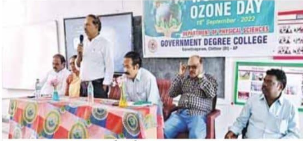
సమావేశంలో ప్రసంగిస్తున్న ప్రిన్సిపాల్