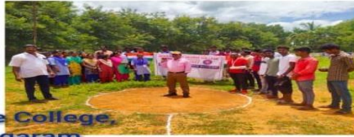
Govt. Degree College, Karvetinagaram Azadi Ka Amruth Mahostav Events